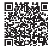
Inscription en ligne

Inscription en ligne dans l'espace " Mes Activités " du site internet de la CMCAS (paiement en ligne ou en CMCAS) ou bulletin d'inscription à retourner à la CMCAS accompagné de votre règlement par chèque. J'ai pris connaissance des conditions générales de vente, consultables sur le site de la CMCAS.