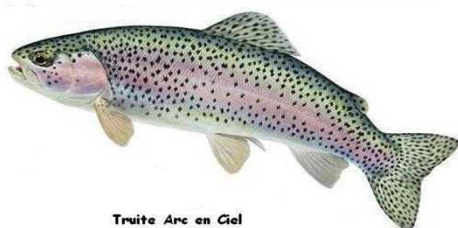
Truite Arc en Ciel